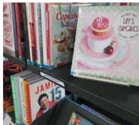
Ein neues Talent entdecken? Auch das geht, mit den diversen Sachbüchern.