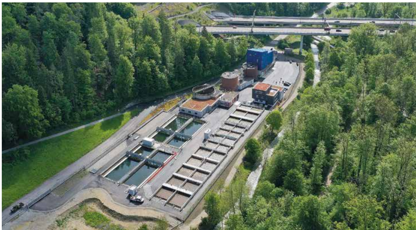
Luftaufnahme der Kläranlage Birmensdorf – bisher ohne die Reinigungsstufe zur Elimination von Mikroverunreinigungen.

Saubere Gewässer sind für unsere Gesellschaft von unschätzbarem Wert. Obwohl die Schweizer Kläranlagen (ARA) gut ausgebaut sind, gelangen problematische Rückstände in unsere Gewässer und damit ins Trinkwasser. Beispiele dafür sind Medikamentenrückstände, Pflanzenschutzmittel oder Kosmetika. Solche Stoffe werden unter dem Begriff «Mikroverunreinigungen» zusammengefasst und werden auf den heutigen ARAs nur teilweise eliminiert. Deshalb wurde vom Parlament beschlossen, gezielt ausgewählte ARAs mit einer zusätzlichen Reinigungsstufe zur Elimination von Mikroverunreinigungen (EMV) aufzurüsten.