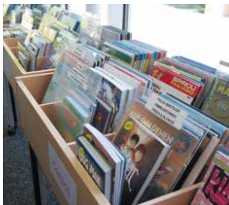
Für Gross und Klein, Comics kommen nie aus der Mode.

Dies wird zuerst durch viel Recherche sichergestellt: Für Artikel und Webseiten zu Neuerscheinungen und heiss diskutierten Büchern, aber auch für Besuche in Buchhandlungen sind sich unsere Bibliothekarinnen nicht zu schade, und sie ergänzen dies mit einem Austausch untereinander, was unbedingt geholt werden sollte. Etwa drei Mal im Jahr werden so für Belletristik Grosseinkäufe gemacht, zu Jahresbeginn, für die Sommersaison, und kurz vor Weihnachten, wobei Aktuelles ebenfalls dauernd ergänzt wird. Serienlesende müssen somit nicht auf die nächsten Sommerferien warten, bis sie ihren nächsten Band erhalten. Ausgesucht werden Neuzuzüger nach vielen Kriterien, beispielsweise ihrem Genre – an Krimi und Thriller, zum Beispiel, darf es nicht fehlen – ihrer Dicke, oder auch dem Design des Textes, damit er für alle gut lesbar bleibt. Hat man einen ganz besonderen Wunsch, darf man sich auch an die Bibliothekarinnen wenden, denn selbst wenn es nicht genug beliebt ist, dass das Buch gekauft wird, kann unsere Bibliothek von der Regionalbibliothek ausleihen. Somit bleibt kein Leseschmack auf der Strecke.