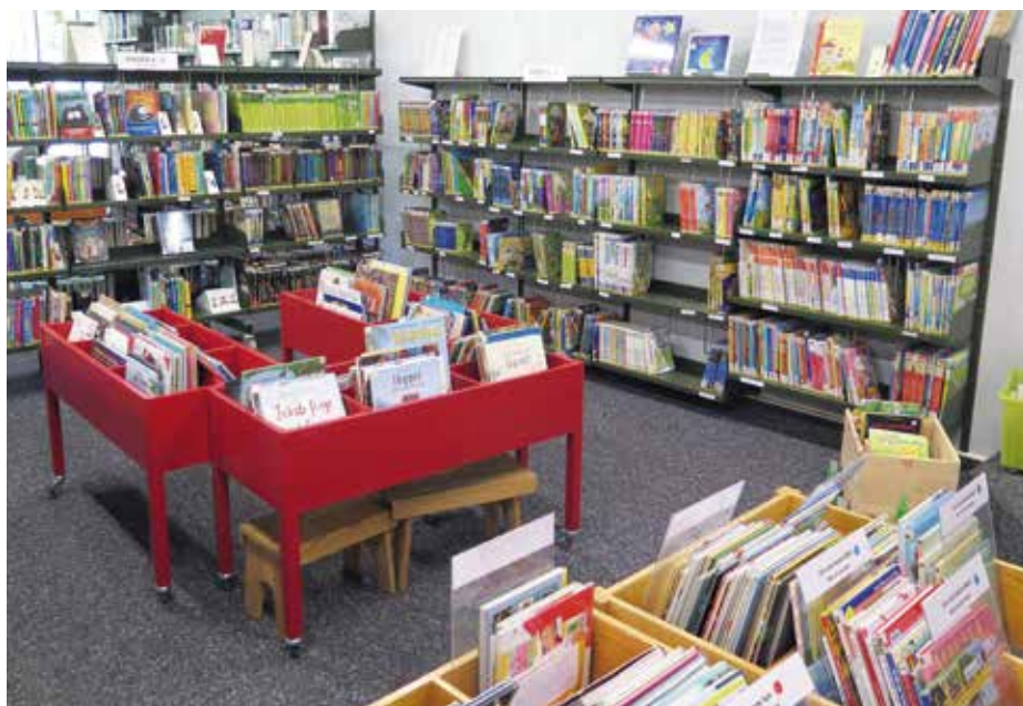
Klassiker und neue Favoriten in der Kinderbuchabteilung.

Mit rund 10'000 unterschiedlichen Medien in den geschulten Händen von vier Mitarbeiterinnen bietet die Bibliothek Bonstetten ein weites Spektrum an Büchern, E-Books, Hörbüchern, Comics, DVDs, Spielen, Magazinen – kurzum an allem, wonach sich Bonstetterinnen und Bonstetter aller Altersgruppen zur Unterhaltung und Stillung der Neugierde sehnen könnten. Für nur 30 Franken im Jahr haben wir die Möglichkeit, nur wenige Minuten von zuhause entfernt in Welten der Fantasie und Abenteuer, der schrecklichen Kriminalfälle, romantischer Liebesgeschichten, spannender Duelle oder unerschöpflichen Wissens abzutauchen. Dieses Angebot wird von uns auch bereits rege genutzt: knapp 1'500 von uns sind aktive Kunden, wobei die Jüngsten – beson-