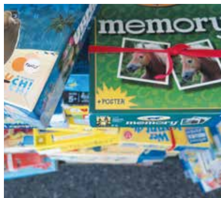
Bei den kunterbunten Spielen laden nur die Anleitungen zum Umblättern ein.

Natürlich können wir nicht von neuen Zeiten sprechen, ohne die Digitalisierung anzuschauen. Diese beeinflusst die Bibliothek natürlich auch: Musik ist schon weitgehend aus den Regalen verschwunden, und mit Streaming Services an allen Fronten sind auch die DVDs rückläufig. Das physische Spiel, ein gutes Kochbuch oder auch die kleine Freude des Umkehrens einer knisternden Seite scheinen aber immer noch sehr modern zu bleiben. Trotzdem können wir auch als Kunden der Bibliothek ohne Kilos von Büchern im Gepäck in die Ferien: mit dem Abo bietet die Bibliothek auch Zugang zur digitalen Bibliothek, wo nebst Büchern aller Genres auch Magazine zu finden sind, die sich auf allen Readern lesen lassen.