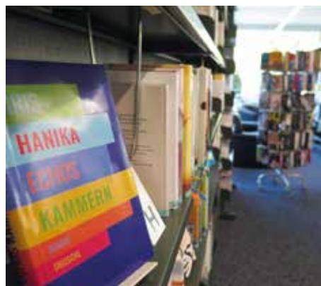
Eine breite Auswahl an Belletristik, die mit immer neuen Protagonisten erscheint.

Ein solches zweites Leben braucht die Bibliothek zum Glück nicht: Obwohl man Klagen hört, die moderne Zeit habe den Büchern abgeschworen, bleibt unsere Dorfbibliothek am Puls der Zeit. Dies sehen wir nicht nur an den immer neuen Medien und Interessen, die im Vordergrund stehen. Comics sind beispielsweise vor allem bei jungen Leserinnen und Lesern beliebt, aber auch die Präsentation der Bücher wandelt sich. Wir folgen Lesetrends immer stärker und sind auf der Suche nach dem Neuen – also folgt auch die Bibliothek den Trends, bietet uns visuelle Präsentation und persönliche Buchtipps der Bibliothekarinnen, dank denen wir auch schnell entdecken können, was uns besonders viel Freude bringen könnte. Wenn wir erst den Geschmack der vier unterschiedlichen Frauen durchschaut haben, wird die Leseerfahrung auch gleich noch spannender – lesen wir gerne zusammen mit Frau Achenbach Heinzlmann, oder möchten wir uns doch diesmal von Frau Büchel überzeugen lassen?