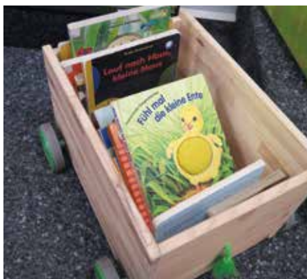
Die Bibliothek – auch ein Ort des Fühlens und Ausprobierens.