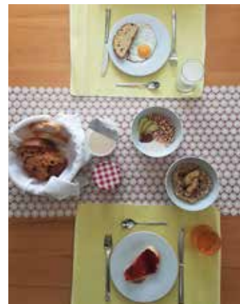
Aus Früchten, die wir von der Blüte bis zur Ernte im Dorf begleiten können, wartet auf uns Bonstetter Most in seiner sonnengereiften Pracht.