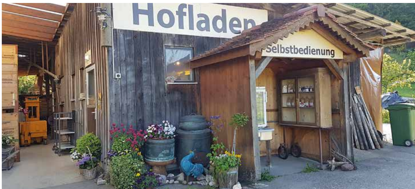
Freundlicher Hofladen – ein würdiges Ziel für den Abendspaziergang.

Die Tage werden länger, die Morgen neblig und die Blätter färben sich: Der Herbst kommt, und mit ihm der goldene Glanz der Sonne auf den Blättern – und den Kürbissen. Wenn die Temperaturen fallen und die Sonnenstunden weniger werden, kommt auch wieder die Lust auf warme Mahlzeiten am dunklen Ende eines langen Tages, die Körper und Herz wärmen. Es ist auch endlich die Zeit all der bunten, leckeren Ernten des Herbstes. Wieso nicht beides kombinieren, und mit saisonaler Frische direkt aus dem Dorf Wunder auf den Tisch zaubern, statt nur Essen zu kochen?