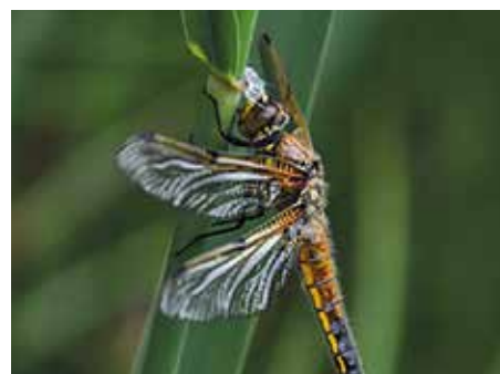
... am nächsten sass dort diese geschlüpfte Libelle.

Der grosse Teich musste schon viel leiden! Zuerst wurden Goldfische ausgesetzt, die die Algen fressen. Dann wurden Steine aufs Eis geschmissen und vielen Molchen platzte die Lunge (genauer die Auftrieblase)! Sogar Alkohol und giftige Spielzeuge landeten im Teich. Spielzeuge mit Neonfarben, die in den Teich gelangen, sind sehr schlecht für den Teich, weil sie die Farbe verlieren und Gift abgeben. Also bitte achten Sie darauf, dass Sie keine neonfarbigen Spielzeuge oder Abfall in den Teich schmeissen. Vielen Dank.