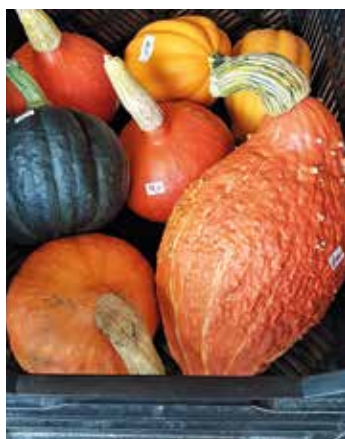
Der Dorfkürbis läutet den Herbst erst richtig ein.

Ist Ihnen die Laune nach einem grösseren, kompakten Angebot, ist ein wenig abseits vom Dorfzentrum, in idealer Distanz um mit dem Velo nach der Arbeit noch fünf Minuten frische Luft schnappen zu können, der Hofladen Wettsteins Hofprodukte . Jederzeit, ob für einen gesamten Tag oder für den Mitternachtssnack, erfreut die kleine Selbstbedienung: Joghurts, Teigwaren, Mostbröckli, sowie Kuchen, Guetzi, Sirup und anderes stehen bereit. Die eigentliche Hauptattraktion ist aber das grössere Sortiment drinnen. Offen zu abendlichen Nach-Arbeit-Zeiten bietet das Lädli Fri-