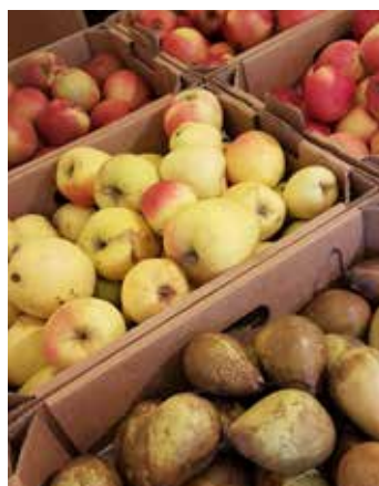
Äpfel und Birnen in Hülle und Fülle.