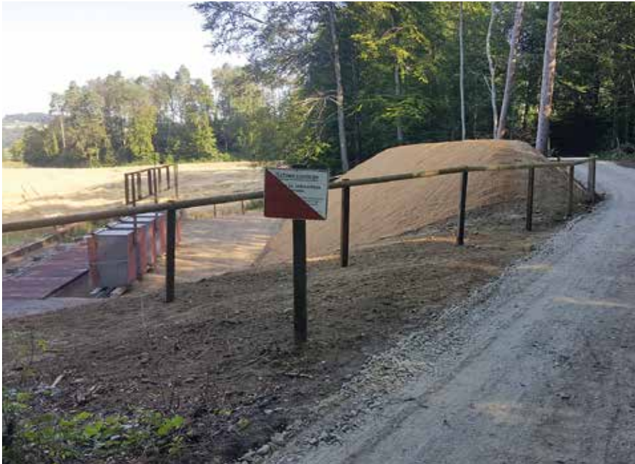
Der Kugelfang der 300-m-Schiessanlage Lochenfeld nach erfolgter Sanierung.

In den 446 Kugelfängen mit über 4200 Scheiben im Kanton Zürich liegen bis zu 3000 Tonnen reines Blei aus einer mehr als 100-jährigen Schiessstätigkeit. Seit 2009 sorgt der Kanton Zürich zusammen mit den Gemeinden und dem Bund dafür, dass die Schiessanlagen umweltverträglich und nach dem Stand der Technik weiterbetrieben werden können. Die angepasste gesetzliche Frist (2020) gibt den Gemeinden die notwendige Zeit, optimale Lösungen