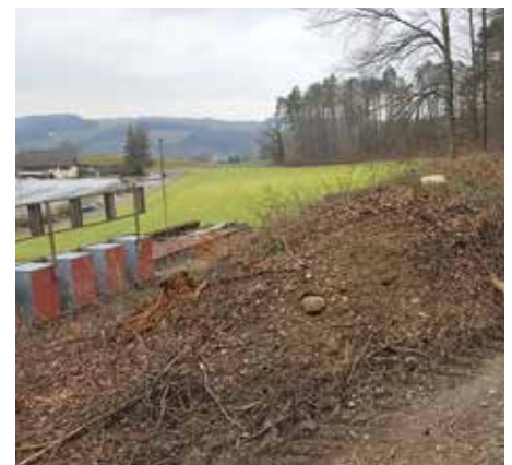
So sah es nach den Rodungsarbeiten aus.