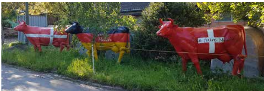
Internationale Kühe posieren für die lokale Milch aus dem Säuliamt.