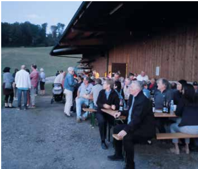
Warten, bis es endlich dunkel wird.