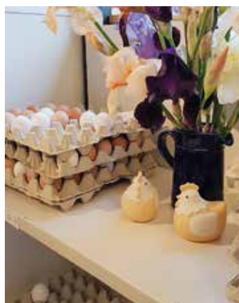
Frische Eier mit solch charmanter Präsentation gibts nur im Hofladen.