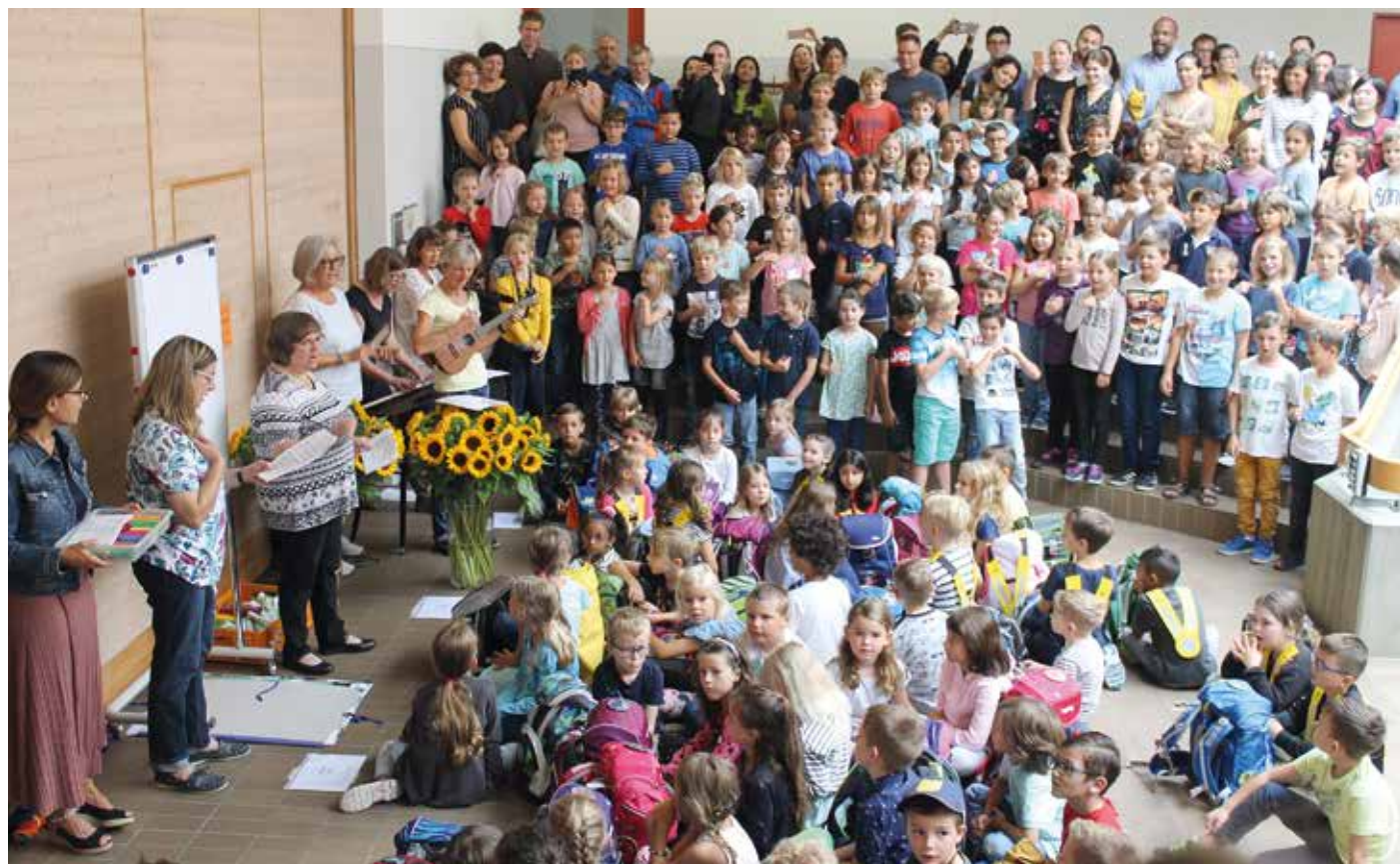
Ein stimmungsvolles Lied von den Grossen für die ErstklässlerInnen.