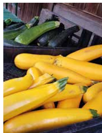
Zucchini: Buntes Gemüse frisch vom Garten.