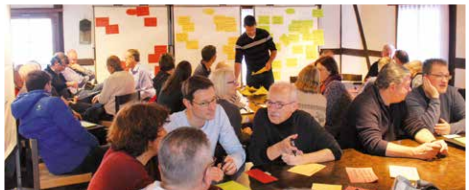
... und in Gruppen.