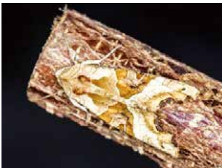
Nachtfalter: Tarnen.

Infos und Details zum Kinderclub unter www.naturnetz-unteramt.ch/kinderclub oder Stefan Bachmann, Tel. 078 740 50 51. Achtung: Die Plätze sind beschränkt; Anmeldung bis am Mittwoch vor dem Anlass.