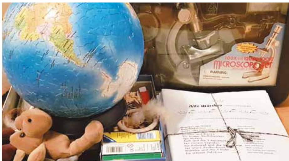
Suchen sehr bald alle ein neues Zuhause – oder die nächste Papiersammlung.

Die Vögel zwitschern, die Sonne scheint, es ist die Jahreszeit des guten alten Frühlingsputzes. Entweder man ist vom neuen Leben der Natur inspiriert, frischen Wind auch ins Zuhause zu bringen – oder man stolpert wie ich über Aufräumshows wie die von Marie Kondo (empfehlenswert und motivierend!) und wird vom Gefühl beschlichen, das Durcheinander hinter verschlossenen Schranktüren und unter dem Bett nicht mehr so leicht ignorieren zu können. Zugegeben, in meinem Fall mag das durchaus auch der Einfluss des halb-leeren Zimmers im Studentenheim gewesen sein, in welchem meine Siebensachen gar kein Chaos hätten machen können. Ausserdem luden schottische Nächte zu gemütlichen Stunden mit Fernsehshows ein ... Wieder im heimeligen Chaos angekommen, machte ich mich also daran, meine Besitztümer zu ordnen. Man kennt die Situation: Man steht vor dem vollen Schrank und denkt sich: «Ich habe nichts anzuziehen!» Oder ihr Gegenstück: man öffnet den Schrank, kann sich nicht orientieren, und nimmt der Einfachheit halber das Erstbeste. Mir war zwar noch nichts auf