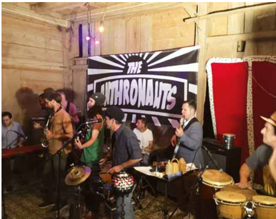
«The Anthonauts» in Aktion.

Der Barbetrieb fängt jeweils um 18 Uhr an. Konzerte sind zwischen 19.30 und 21.45 Uhr. Eintritt Frei (Kollekte)