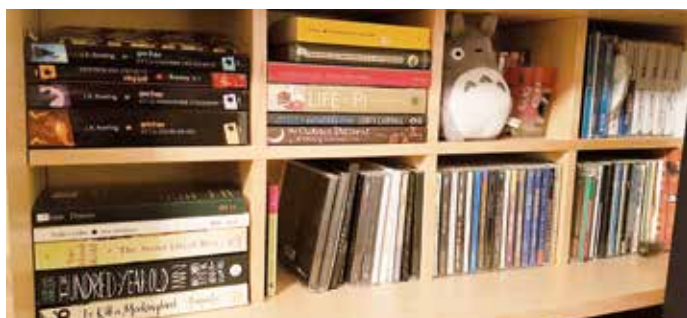
Das Ziel des Frühlingsputzes: der Stolz, wenn man seine Regale sieht.

Ich fand diverse Möglichkeiten, meine Sachen sinnvoll loszuwerden. Alles was wiederverwendet werden kann, darf und sollte ein zweites Leben geniessen dürfen. Hat man Freunde oder Familie, die etwas