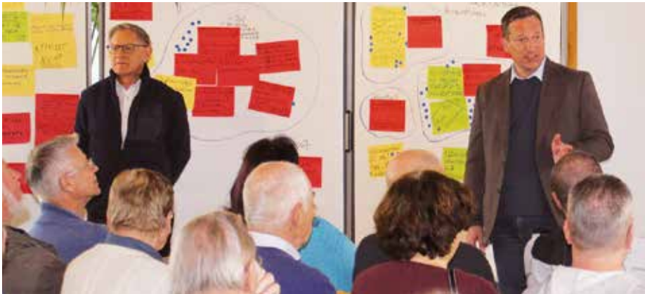
Schlusswort nach einem erfolgreichen Morgen.

Auf Einladung des Gemeinderates Bonstetten trafen sich am 26. Januar 2019 über 150 Einwohnerinnen und Einwohner. Thema war und wird bleiben – die Zukunft von Bonstetten.