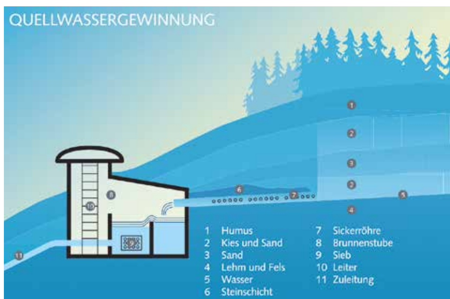
Schema einer Quellwassergewinnung.