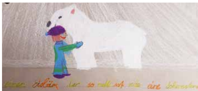
Ich hatte keine Ahnung, was ein Schwestern-Bär ausrichten könnte ...