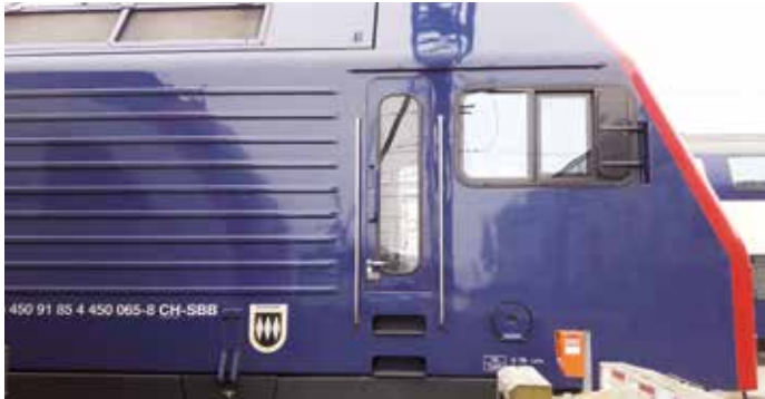
Lokomotive mit Bonstetter Wappen.