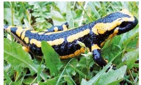
Feuersalamander: Gift-Tiere.