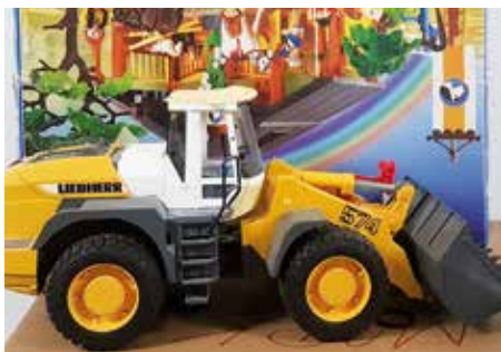
Da wird sich bestimmt ein anderer daran erfreuen.

Samstag, 15. Juni 2019, Sportzentrum Schachen Bonstetten