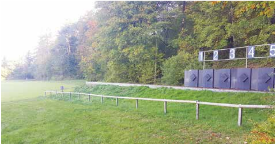
Die Schiessanlage Lochenfeld.

In den 446 Kugelfängen mit über 4200 Scheiben im Kanton Zürich liegen bis zu 3000 Tonnen reines Blei aus einer mehr als 100-jährigen Schiessstätigkeit. Seit 2009 sorgt der Kanton Zürich zusammen mit den Gemeinden und dem Bund dafür, dass die Schiessanlagen umweltverträglich und nach dem Stand der Technik weiterbetrieben werden können. Die angepasste gesetzliche Frist gibt den Gemeinden die notwendige Zeit, optimale Lösungen zu finden. Wenn schadstoffbelastete Kugelfänge Grundwasser, Gewässer oder Boden