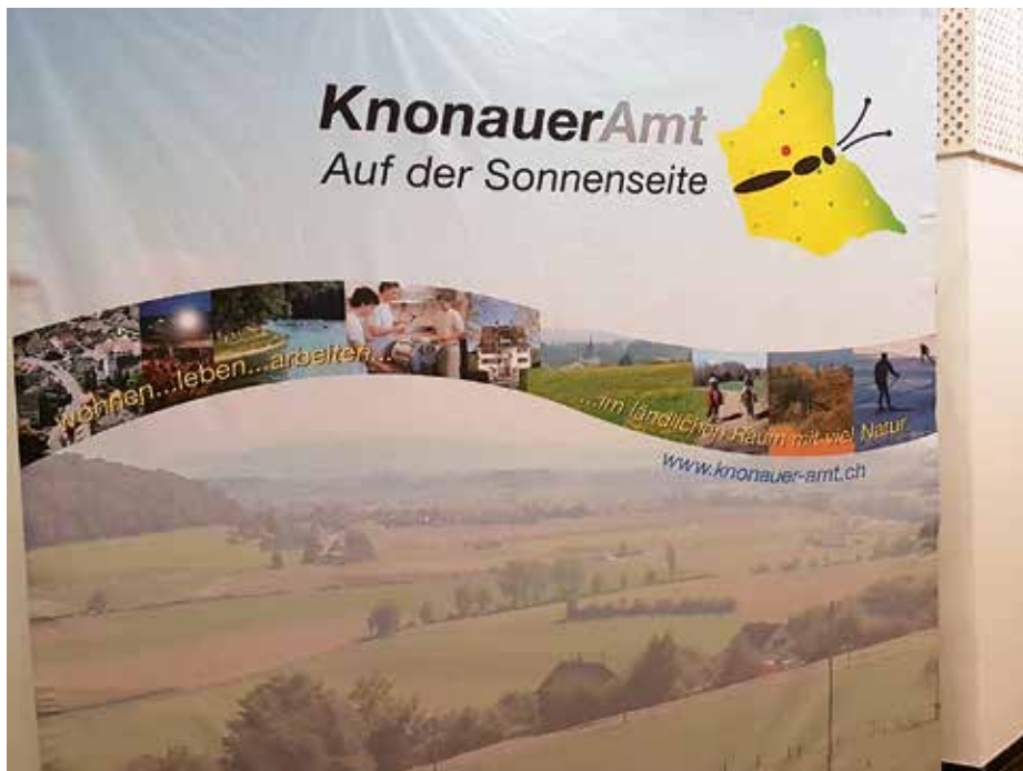
Ein elegantes Willkommen in der Standortförderung.

Bonstetten ist neu wieder dabei – und so fand der Frühlingstreff der Standortförderung Knonauer Amt in unserem Gemeindesaal statt.